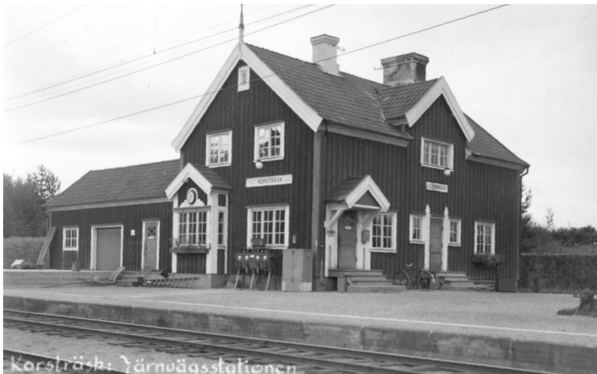
Korsträsk Järnvägsstation. Bilden finns på Älvsbyns Forskarförenings hemsida. Kersh01-17 14:12