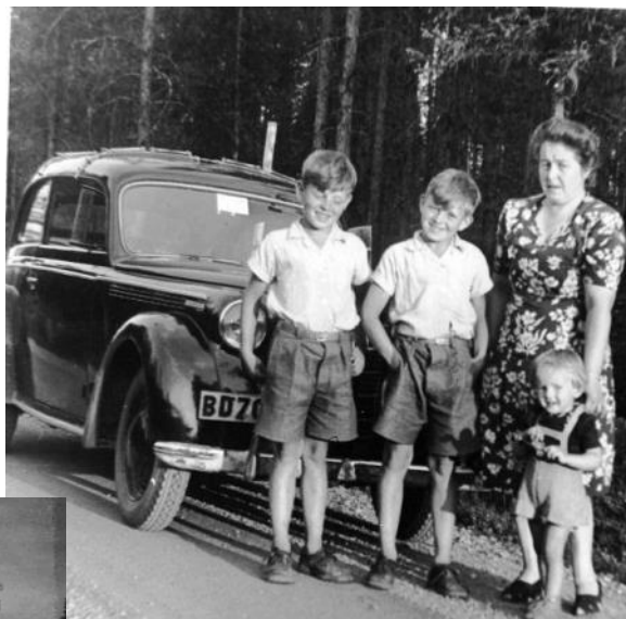
Opel Olympia årsmodell 1938