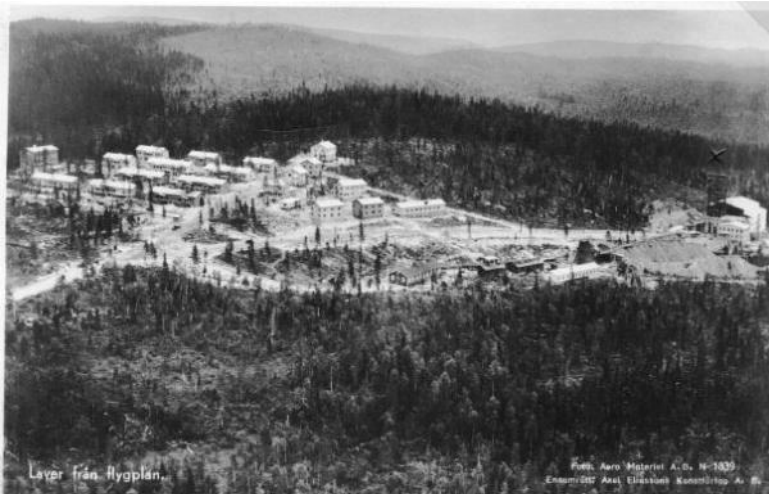
Vy över Laver