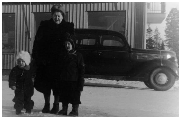
Forden (V8 årsmodell 1936) i Adakgruvan 1951