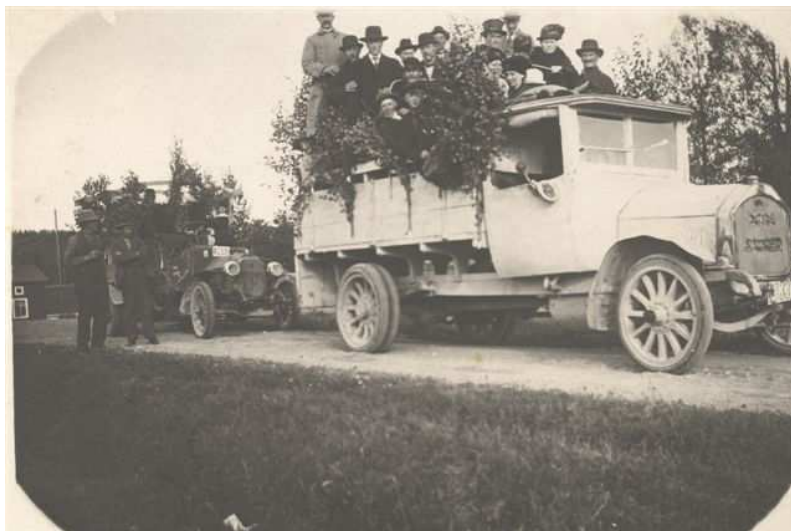
Vilka personer är detta? Var har fotot tagits? Den främre bilen är en Man Saurer registr.nr BD337 och den bakre har registreringsnumret AC521