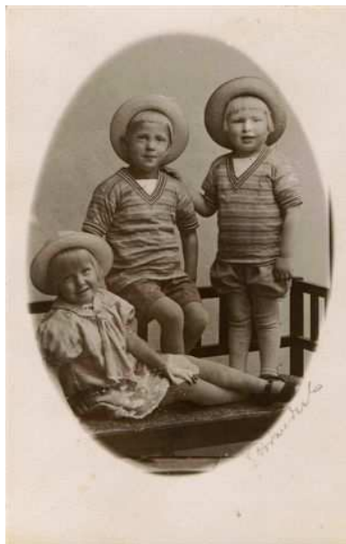
Vilka är dessa barn?

Vi har på vår hemsida en hel del gamla foton som vi behöver hjälp med att identifiera. Här nedan har Ni två exempel. Gå in på vår hemsida och titta närmare på bilderna! Kom till oss i Forskningslokalen så visar vi gärna fler bilder!