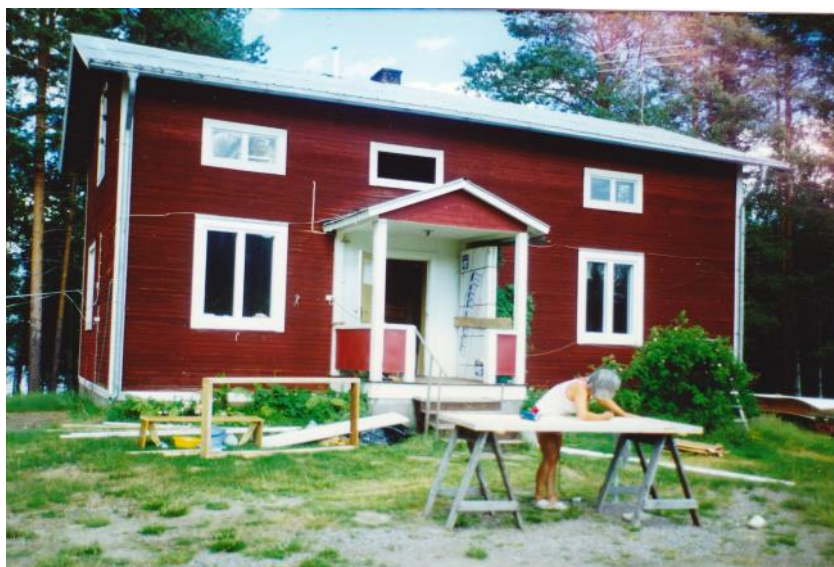
Här är Barbro i full gång att hjälpa till med renoveringar av huset år 1988.

När jag själv började arbeta utanför hemmet minns jag att jag tänkte mycket på mina småsyskon och längtade efter dem.