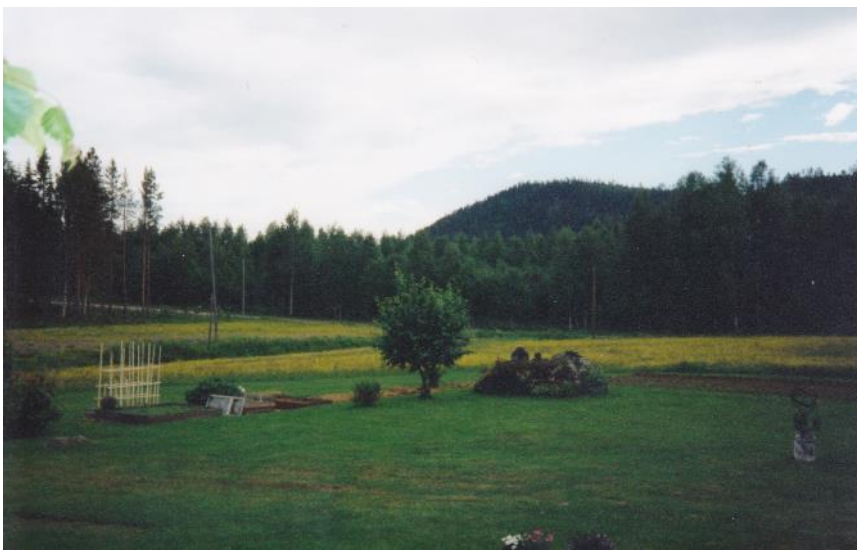
En bild på den "stora stenen". Typiskt att det man minns som barn alltid var så stort???? På vänster sida syns Vägen som gick förbi till Vistbäcken och ansluter till Arvidsjaurvägen.

På gårdstunet fanns en stor sten som många minnen är förknippade med. Där satt vi och lekte med våra dockor som i regel var små och billiga. Mest hade vi så kallade baddockor som var utan kläder när man köpte dem. Materialet i dockorna var celluloid och armar och ben gick att röra. Det var en gumminodd som höll fast ben och armar mot kroppen. Vi sydde kläder till dockorna själva och satt då ofta på storstenen om det var bra väder. Eller så satt vi där och handarbetade. Jag minns särskilt en gång när jag satt och broderade på en duk och åskan började gå så det var bara att springa in. Vi lekte ofta med pappersdockor som vi ritade kläder till och klippte ut.