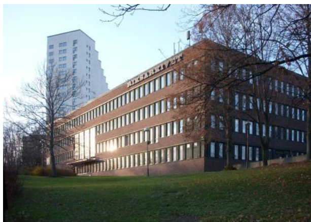
Riksarkivets huvudbyggnad i Stockholm.

Någon historieforskning skedde inte innan dess men nu började man intressera sig för fornyfynd och andra historiska dokument. Sverige var bland de första länderna i världen att inrätta ett statligt riksarkiv och en riksantikvarie som ansvarig. Det blev historikern Johannes Bureus som fick uppdraget.