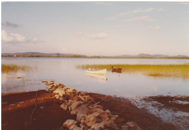
En bild av badstranden på senare tid.. Var även en bra fiskesjö.

Agnet fiskade vi bara några meter rakt ut från vår strand, men sen rodde vi inöver sjön till ett ställe där det stack upp tre strån av vass. Där hade vi fått för oss att de största abborrarna stod. Och ibland lyckades vi faktiskt få riktigt fina abborrar som vi kokade till frukost. Det fanns ett annat bra ställe att fiska på och det var grundet. Dit vågade vi oss inte när vi var ensamma. Ibland följde pappa med och då rodde vi till grundet, som låg mitt i sjön.