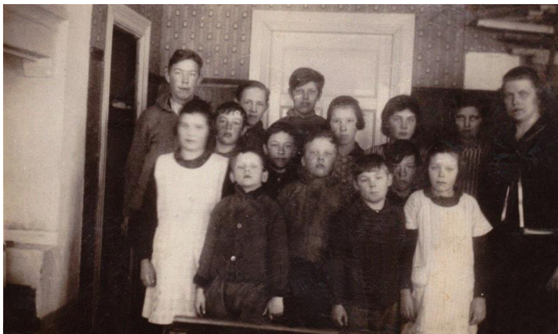
Skolklass men är detta från Sörstrand???