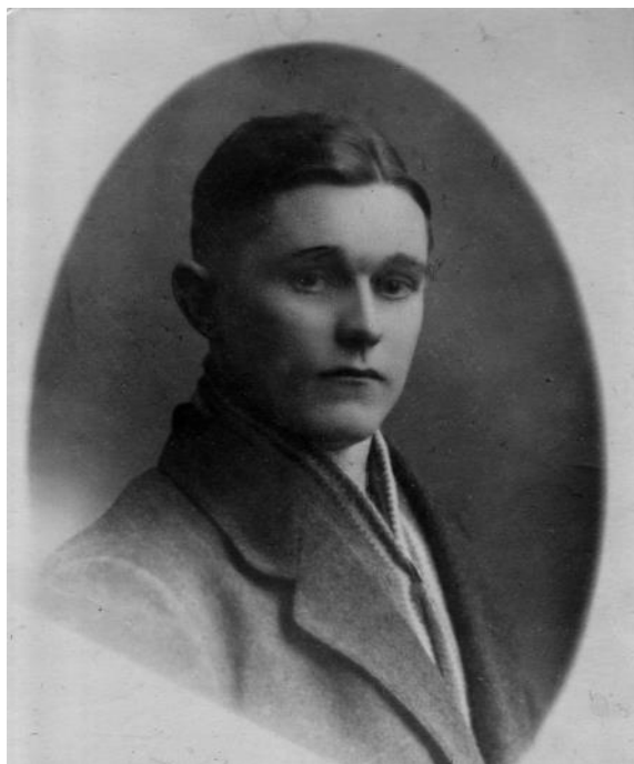
Känner någon igen mannen?