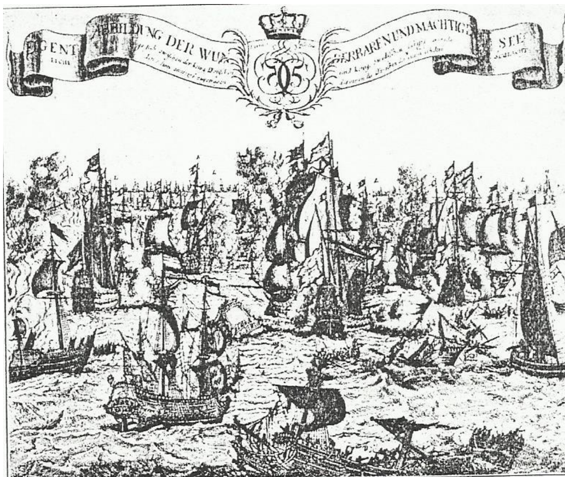
Sjöslaget vid Ölands södra udde 1676 där många soldater från Västerbottens regemente omkom.