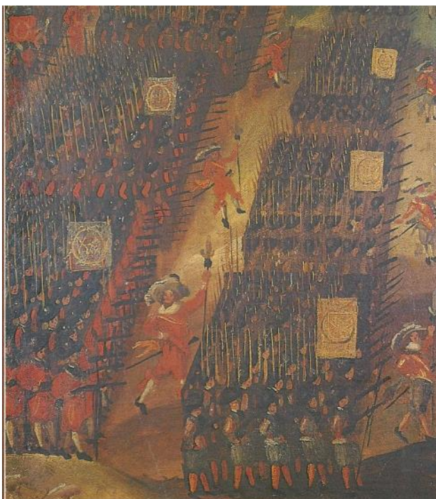
Delar av Norrlands storregemente 1626, vari även knektar från Luleå och Piteå socken ingick.

Förvisso finner vi en del älvsbybor bland de västerbottningar som bemannade garnisonsorter som Altdamm, Demin, Stralsund och Stettin i Nordtyskland. Kanske deltog man också i Danska kriget 1644-45, då västerbottningar kom att sättas in som änterkarlar på flottan och trupper i Jämtland. Dessa gjorde bl a tjänst i sjöslaget vid Kolberger Heide och försvaret av Frösö skans.