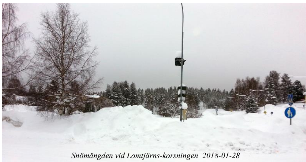
Snömängden vid Lomtjärns-korsningen 2018-01-28