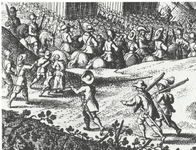
I förgrunden svenska infanterisoldater vid stormningen av Frankfurt an der Oder 1631.