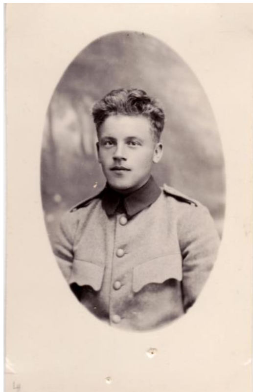
Känner någon igen mannen?