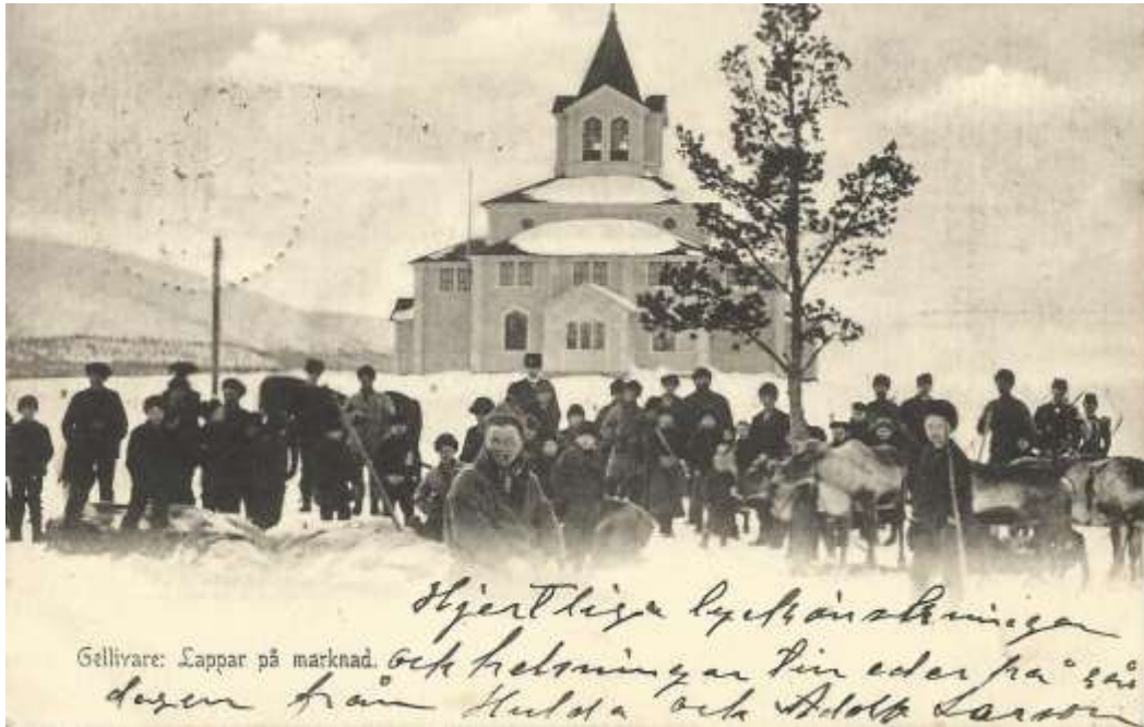
Gällivare kyrka med besökare på vintermarknad omkr. år 1900.