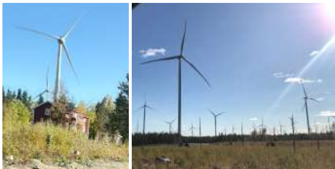
Nya ”grannskapet” i Markbygden. Här blir aldrig livet som förr heller.....