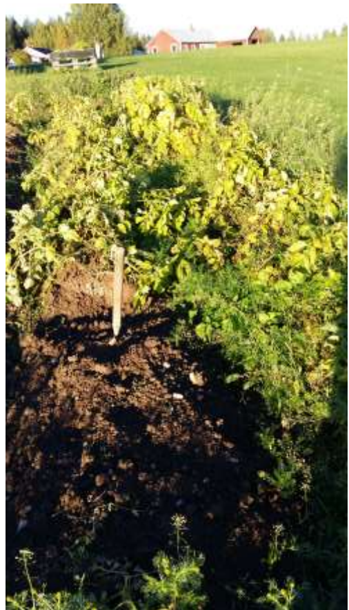
Här är upptagningen påbörjad, vä pärogräve kvar (potatisgräv). Öte Markströms i Grenträsk.