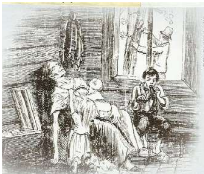
Illustration från missväxtåren 1867-68, som även kan appliceras på de svåra missväxtåren under 1830-talet.