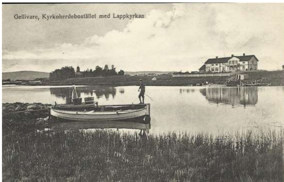
Gällivare med kyrkoherdebostället och den s k Lappkyrkan vid förra sekelskiftet .