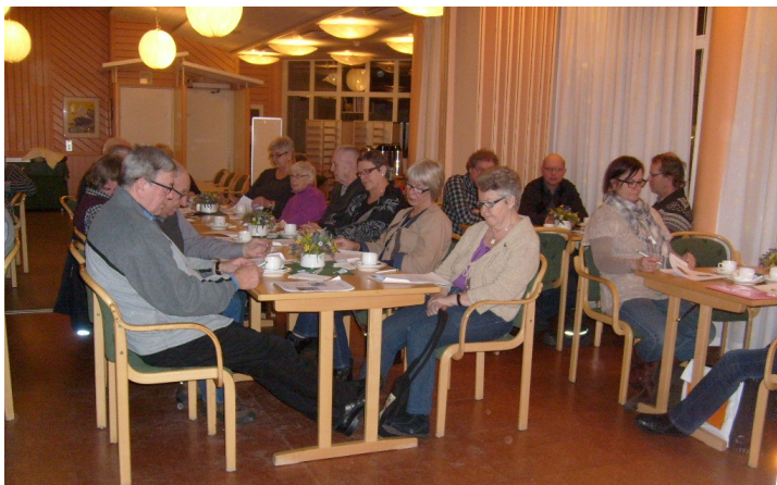
Bild från Älvsbyns Forskarförenings årsmöte på Fluxen 2012