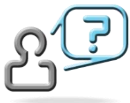
Uppe till vänster står Edit Karls- son, (2) född 1899 4:an är Carl Carlsson född 1902 Vet någon vem 1 och 3 är????